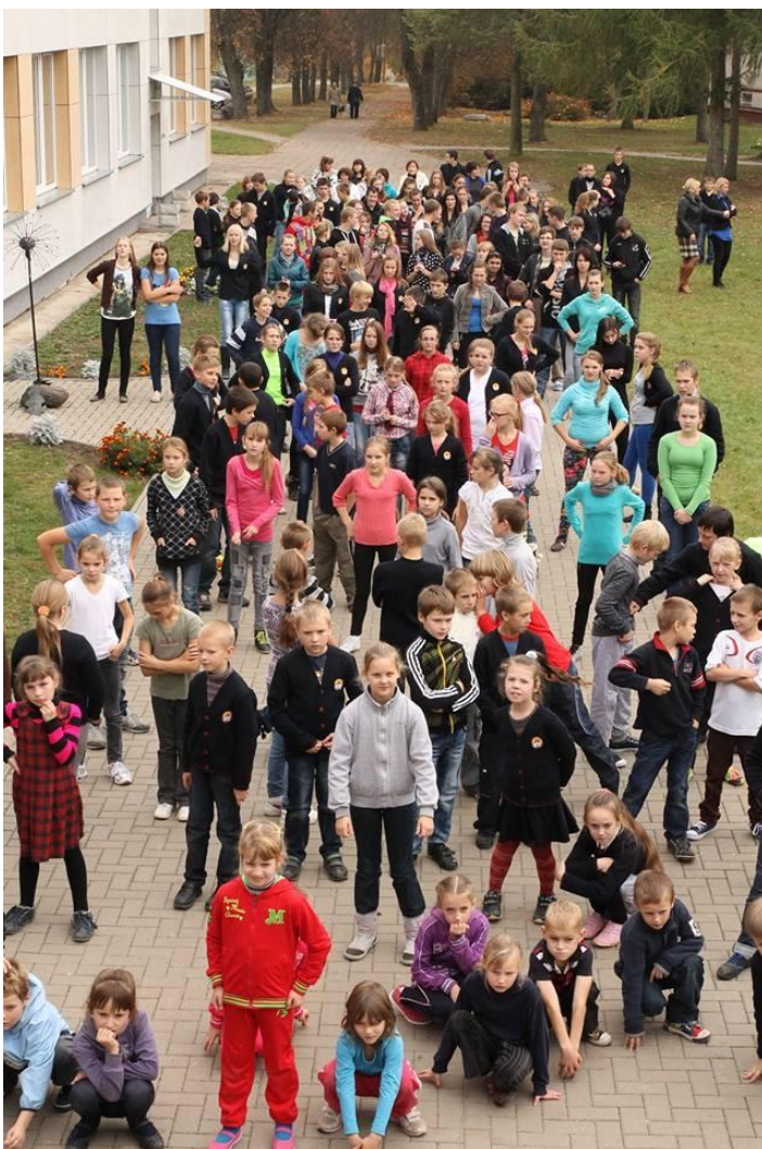
„Flashmob‘ų“ manija atkeliavo ir į mūsų mokyklą.

— Stengsimės nenuvilti. Labai dėkojame už pokalbį ir linkime Jums kuo geriausios sėkmės.