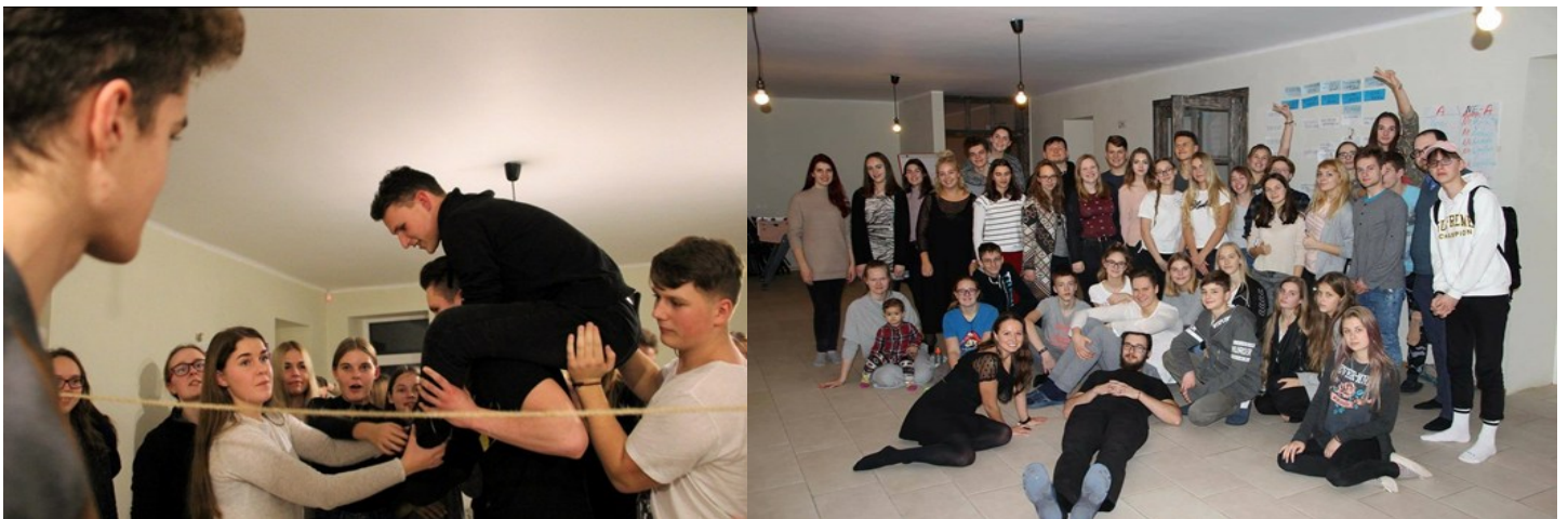
Laikraštį maketavo: Edvinas Mikalaičiūnas

Džiaugiamės turėdamos galimybę dalyvauti bendraamžių švietėjų programoje,